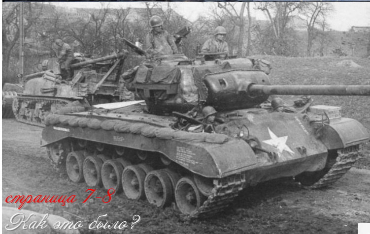
страница 7-8 Как это было?