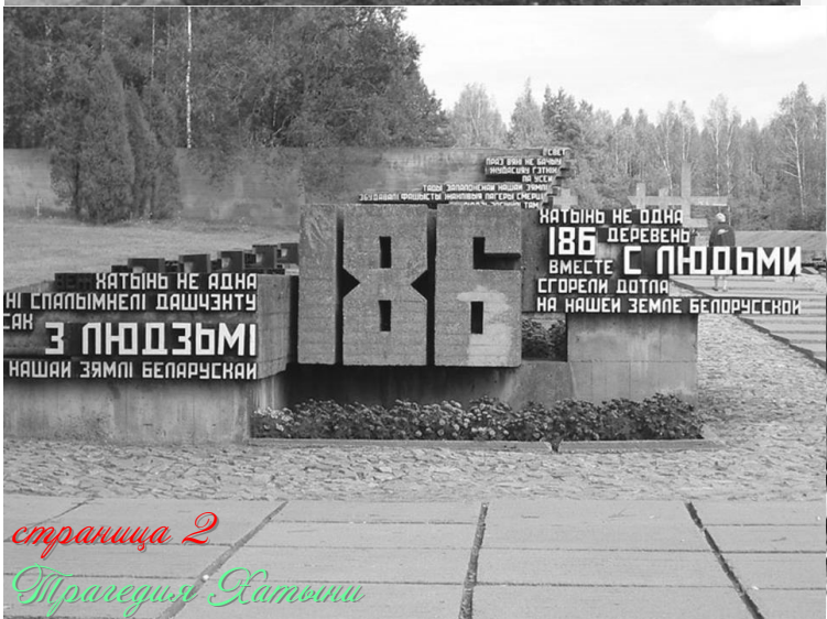
страница 2 Трагедия Натыни