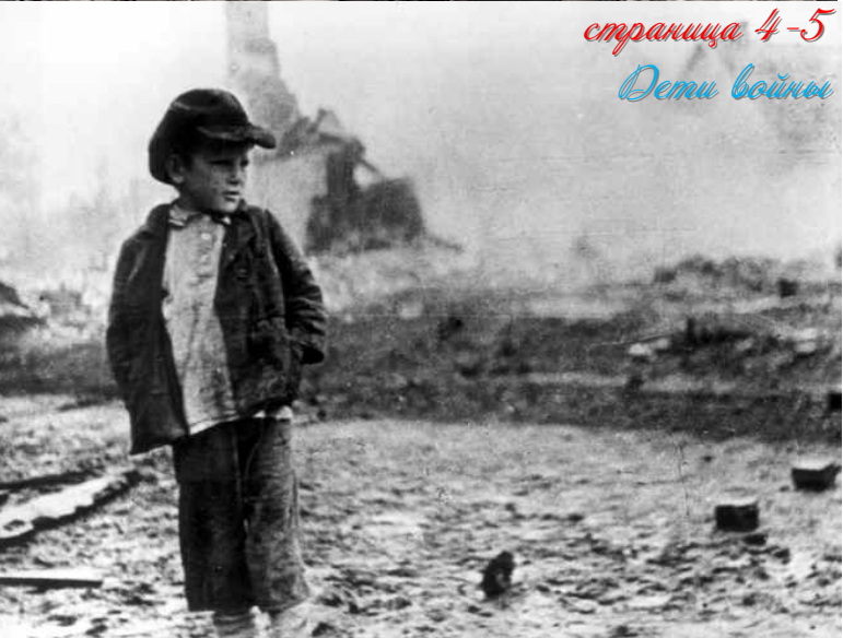
страница 4-5 Дети войны