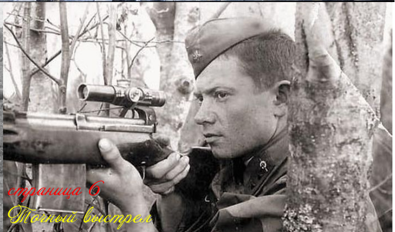
страница 6 Точный выстрел